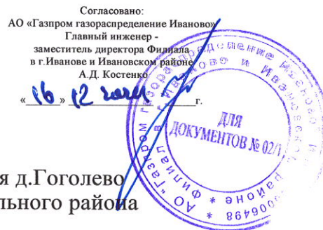
Схема газоснабжения д. Гоголево Ивановского муниципального района